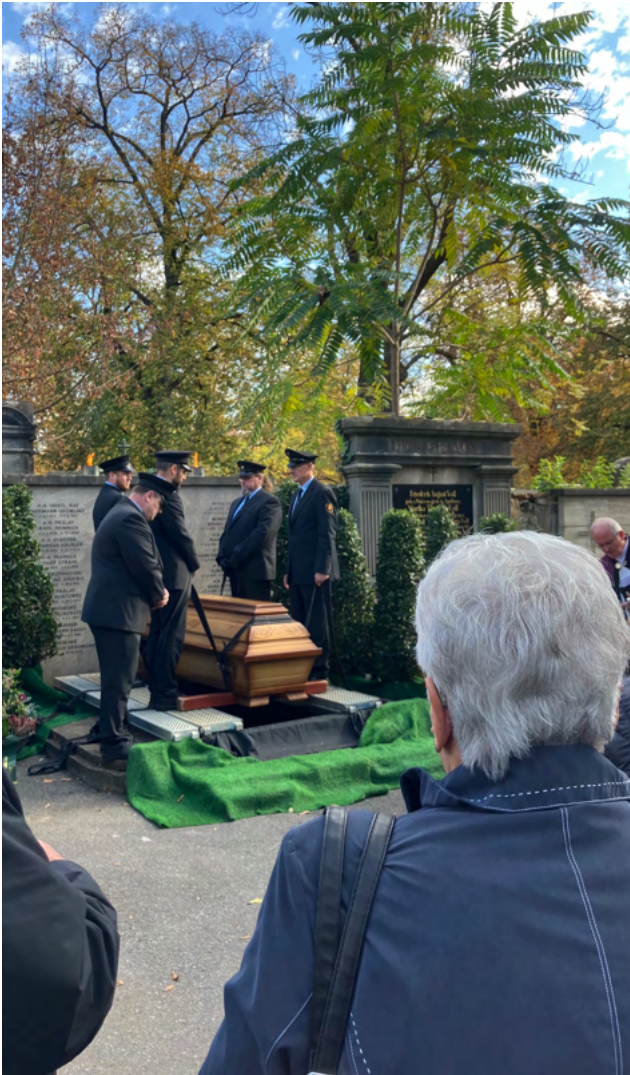
Beisetzung im Priestergrab des Hauptfriedhofs Würzburg