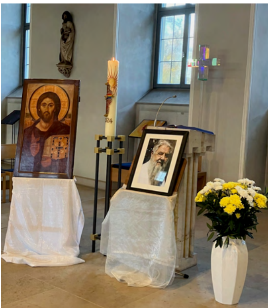
Requiem für Prof Suttner, St. Kilianskapelle, Juliusspital Regensburg