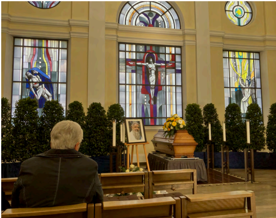
Aussegnungshalle, Hauptfriedhof Würzburg